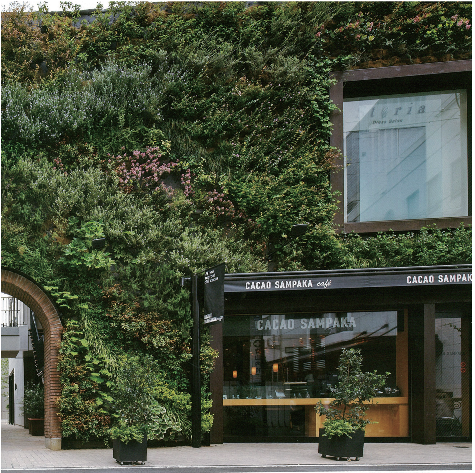
セットバックしたことで巨大な壁面の圧迫感がない。そのことにより人が植物に近づいたり触れたりできる「溜まりの場」となった