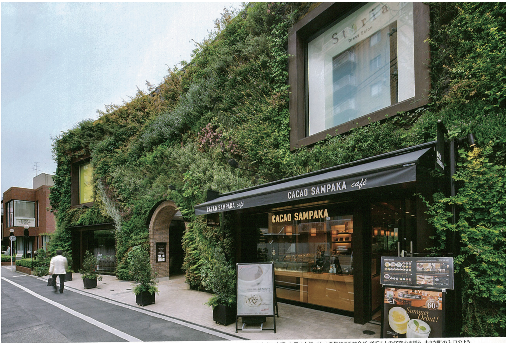
左頁/南青山に出現した巨大な緑。ゲートの先にある教会が、道行く人の好奇心を誘う。小さな町の入口のよう。上/ランチやスイーツを楽しめるショップが入る。緑に囲まれてランチを楽しむ女性客も多い