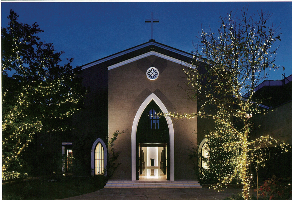
左頁／不織布に切り込みを入れポケットをつくる。そこに土壌を加え植栽するというシンプルな工法。上／ライトアップにより浮かび上がる壁面緑化は、南青山の新たな名所。下／外観同様、教会内部もシンプルであることがうかがえる。色を添えるのは、新郎新婦