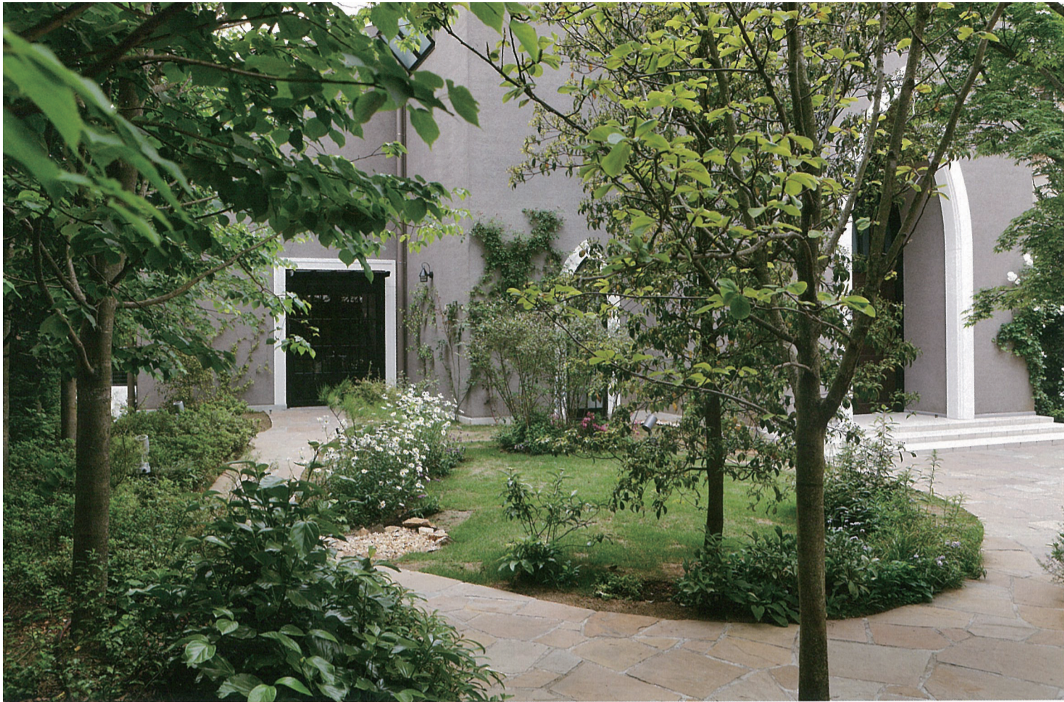
教会がシンプルだけに、緑が重要な要素になる。5年後、10年後を見据えた植栽は、やがて教会を包み込む森へと生長する